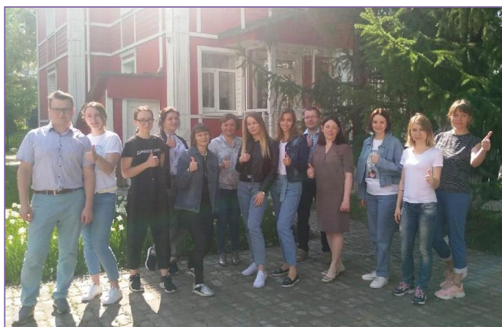
Участники встречи «Спортивный выбор»