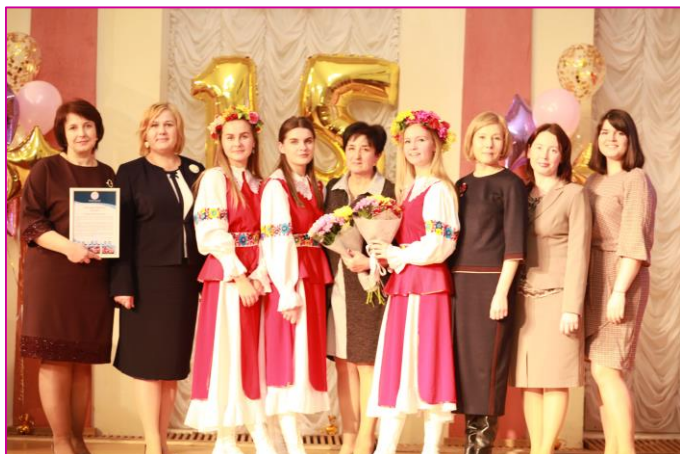
Гости из Республики Беларусь

В завершение торжественного мероприятия прозвучала песня от коллектива и обучающихся НОЦ.