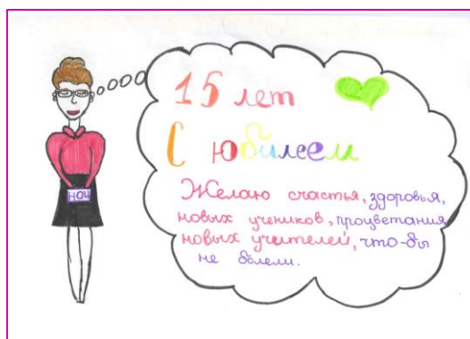
Лучшие поздравительные открытки

Благодарим всех участников за активность и желаем дальнейших творческих успехов!