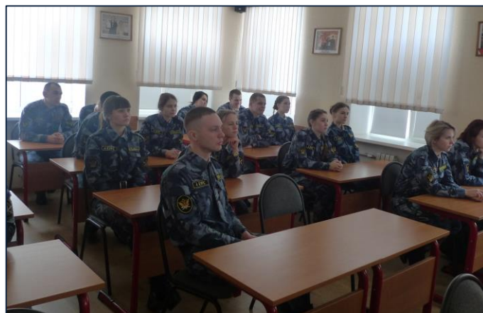
В ходе Экономического лектория