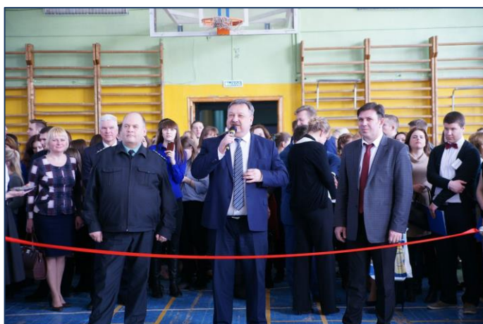
Открытие «Ярмарки вакансий – 2018»

21 марта сотрудники НОЦ приняли участие в «Ярмарке вакансий – 2018», организованной ФГБОУ ВО «Вологодский государственный университет».