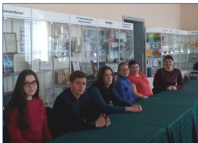
Обучающиеся 10 ОГ класса