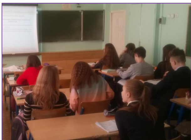
Во время заседания Дискуссионного клуба

22 марта состоялось заседание Дискуссионного клуба на тему «Проблемы подростков: пути решения». Участниками мероприятия стали обучающиеся 10 класса МОУ «Лицей №32». Все школьники отметили актуальность и значимость для них рассматриваемой темы. В ходе заседания были затронуты различные вопросы, волнующие подростков: