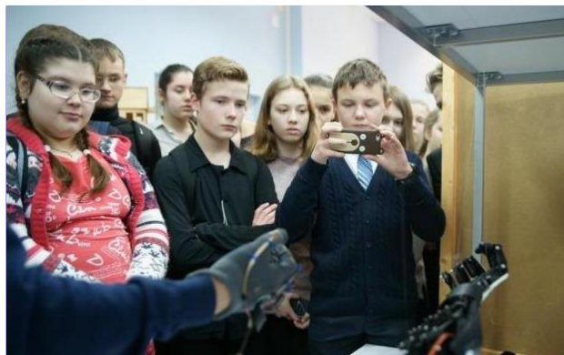
Проект «Новая система управления механической рукой с использованием датчиков изгиба»

Мероприятие помогло обучающимся расширить свое представление о высшем профессиональном образовании, разобраться в карьерных перспективах, определить направления личностного развития.