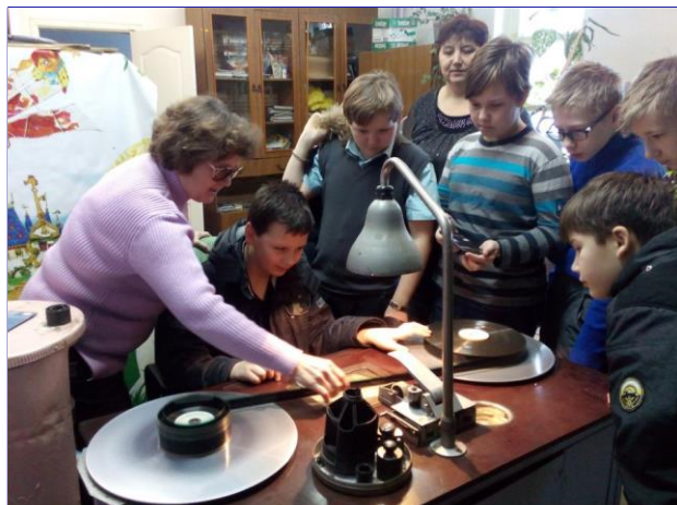
6 класс практикуется в прогоне пленки

То, что они всё могли попробовать делать сами, особенно понравилось школьникам в ходе этой увлекательной экскурсии.