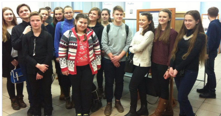
Обучающиеся НОЦ в лаборатории инновационных разработок

Мне очень понравилась эта экскурсия. Нам удалось самим заправить пленку в киноаппаратной, устранить ее дефекты. Мы узнали о том, как хранились и транспортировались фильмы. Спасибо за интересное мероприятие!