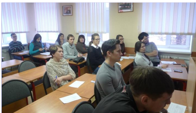
Во время творческого семинара