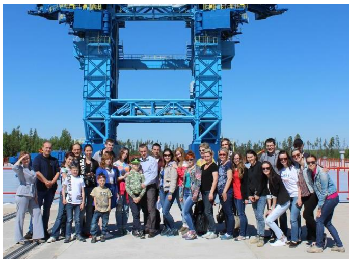
На стартовой площадке космодрома