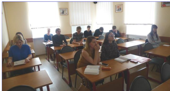
Участники Часа аспиранта