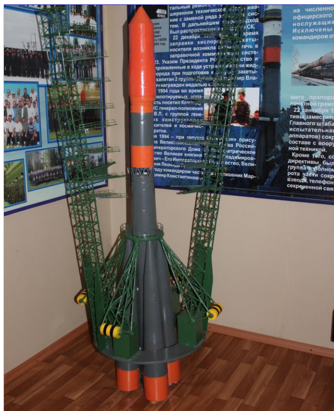
В музее космодрома

Попов А.В.: «Запуск ракеты был запланирован на 11 часов 44 минуты 53 секунды. Мы остановились в полутора километрах от стартового комплекса на своеобразной смотровой площадке. Точно в срок вдали раздался рев двигателей, и из-за макушек деревьев показалась ракета-носитель среднего класса «Союз-2.1б», которой предстояло вывести на орбиту очередной навигационный спутник. Ракета скрылась из поля зрения спустя, примерно, 300 секунд после запуска.