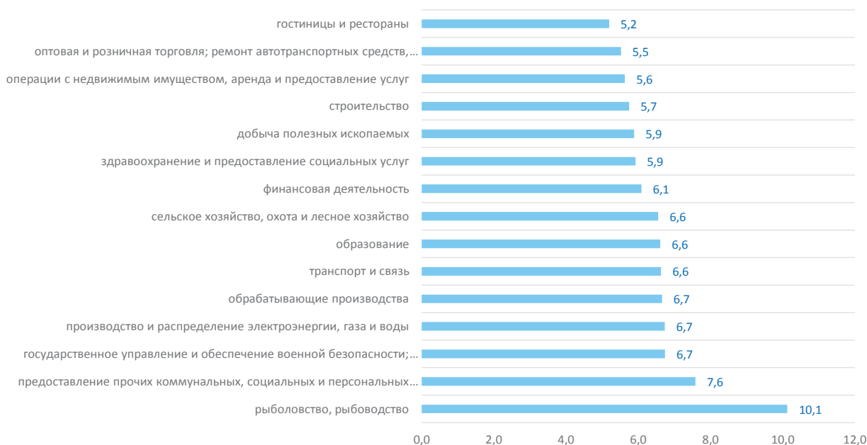
Рис. 2. Отношение совокупного объема среднемесячной номинальной начисленной заработной платы работников организаций Вологодской области за 2009 – 2013 гг. к 2008 году, раз