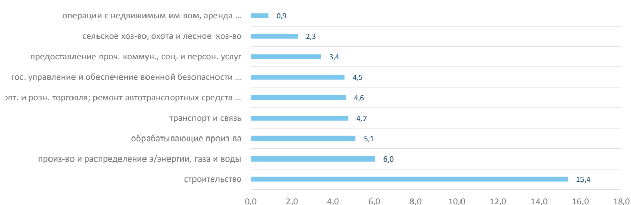
Рис. 3. Отношение совокупного объема заказов на поставку продукции в последующие периоды организаций Вологодской области* за 2009 – 2013 гг. к 2008 году, раз

*В связи с отсутствием данных из анализа исключены виды деятельности: рыболовство и рыбоводство, добыча полезных ископаемых, гостиницы и рестораны, финансовая деятельность, образование, здравоохранение и предоставление социальных услуг.