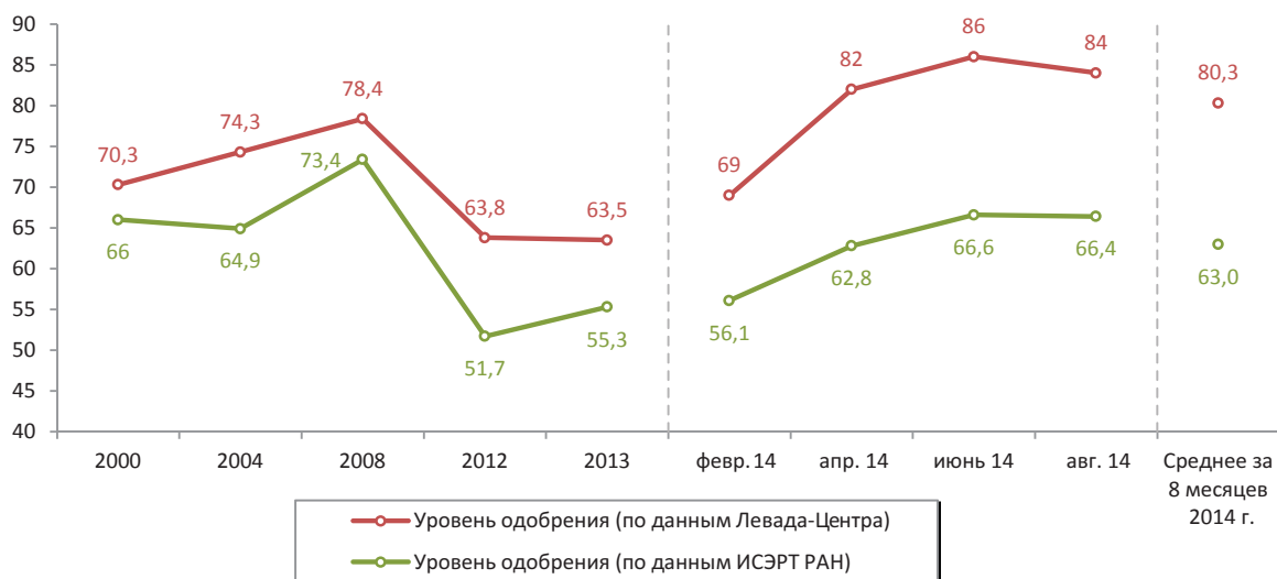
Рис. 1. Динамика уровня одобрения деятельности президента РФ жителями Российской Федерации и Вологодской области, % от числа опрошенных