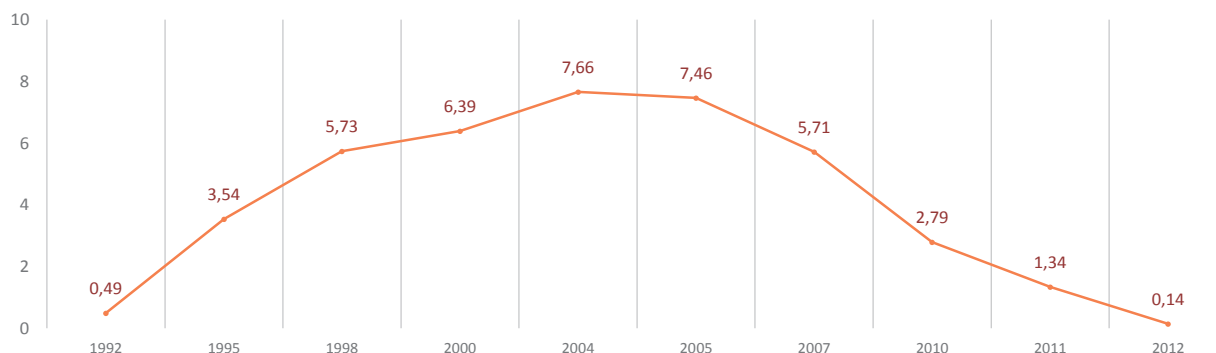
Рис. 1. Доля коммерциализированных патентов в России в 1992 – 2012 гг.

В результате число университетов, вовлеченных в процесс трансфера техноло-