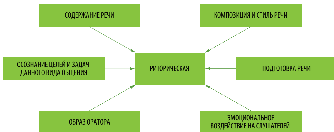
Рис. 2. Факторы формирования риторической компетенции

Совершенствование системы подготовки специалистов высшей научной квалификации – одна из центральных задач, на решение которой направлена совместная деятельность представителей высшей школы, академической и отраслевой науки. В Институте социально-экономического развития территорий Российской