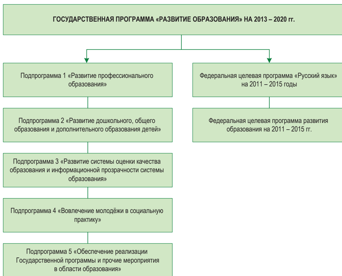
Рис. 2. Структура Государственной программы Российской Федерации «Развитие образования» на 2013 – 2020 гг.

Целевые индикаторы программных документов должны отражать актуальные проблемы развития образования (существенные различия в финансировании образования по регионам РФ, разная