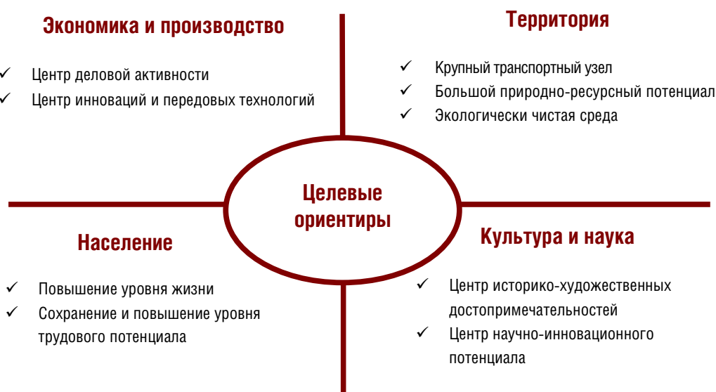
Рисунок 3. Основные целевые ориентиры развития агломерации