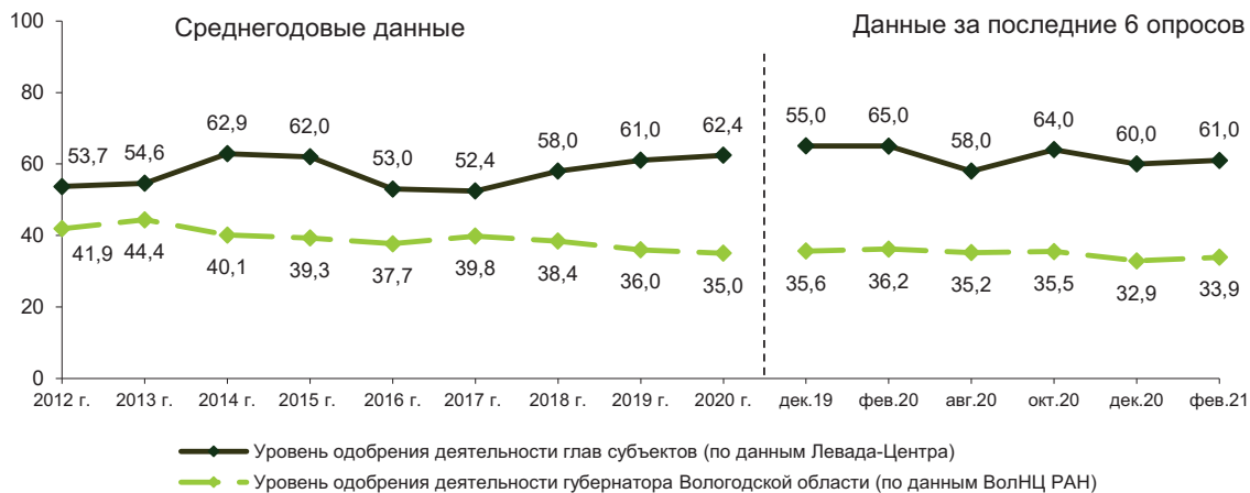
Рис. 9. Уровень одобрения деятельности глав субъектов РФ (в % от числа опрошенных)