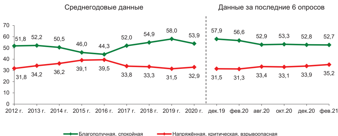
Рис. 11. Оценка населением политической обстановки в области (в % от числа опрошенных)