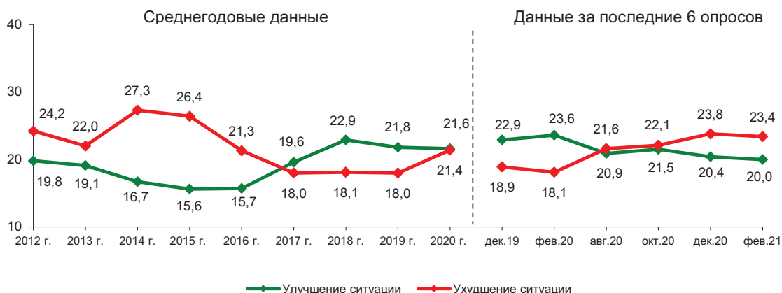
Рис. 12. Что ожидает область в ближайшие месяцы в политической жизни? (в % от числа опрошенных)