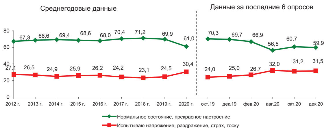
Рис. 24. Динамика показателя социального настроения (в % от числа опрошенных)*

* Распределение ответов на вопрос «Что бы Вы могли сказать о своем настроении в последние дни?»