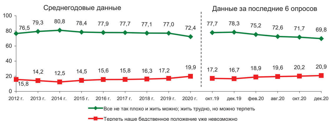
Рис. 25. Динамика показателя запаса терпения (в % от числа опрошенных)*