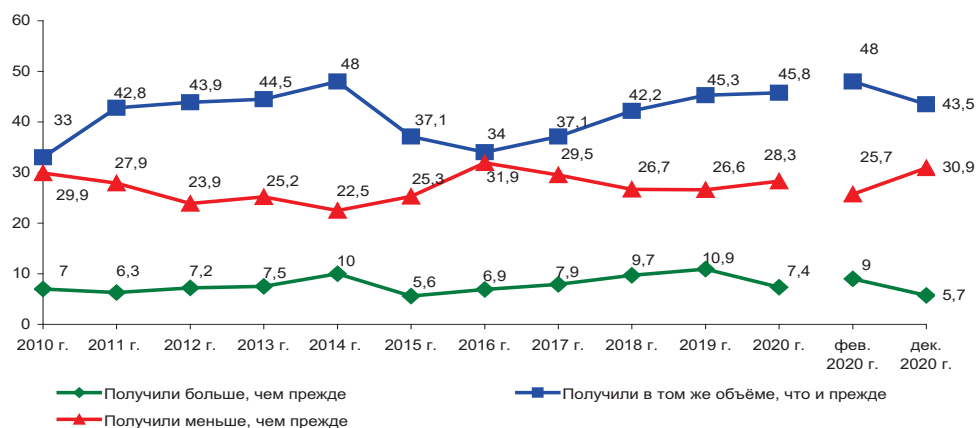
Рис. 18. Как изменилось количество (объем) услуг, полученных Вами на платной основе, в прошлом году по сравнению с предыдущим годом? (в % от числа опрошенных)*

*Вопрос в феврале каждого года, с 2010 года.