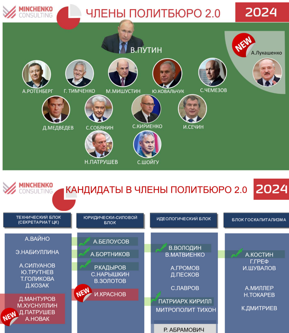
Рис. 2. Состав членов Политбюро 2.0 и кандидатов в члены Политбюро 2.0

Для справки (в алфавитном порядке):