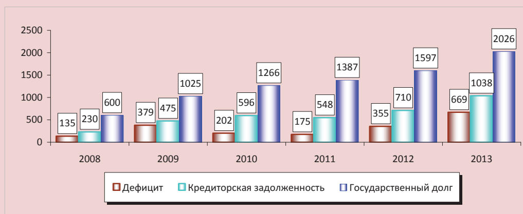
Рисунок 3. Динамика дефицита, государственного долга и полученных кредитов консолидированных бюджетов субъектов РФ, млрд. руб.

Источник: рассчитано по данным отчетности Казначейства России, Минфина РФ.