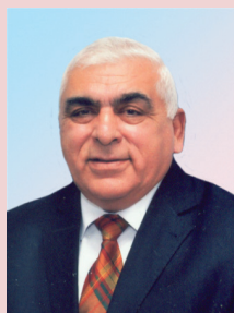
Адалят Байрамали оглы АЛИЕВ

Инновация, государственная политика, структурные преобразования, инвестиционно-инновационный потенциал, инновационная политика, законотворчество, инновационные категории, экономическая безопасность, возрождение промышленной и научно-технической сферы.