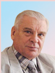
Александр Иванович ТАТАРКИН

Пространственное развитие; его источники; факторы и институты программно-проектного управления трансформационными процессами; саморазвитие регионов и территорий как наиболее эффективный институт федеративного устройства общества; стратегия кластерного и программно-проектного планирования и управления пространственным развитием.