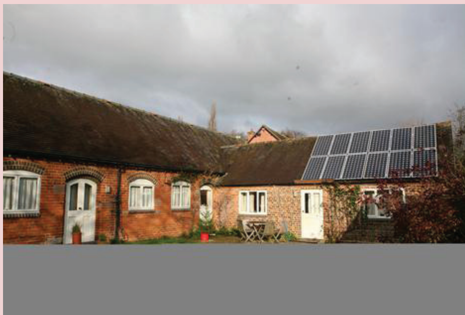
Рисунок 2. Пример фактического результата практического применения LLL

Говоря о фактическом результате практического применения LLL на Западе, можно привести пример (case study) установки солнечных панелей и улучшения теплоизоляционных свойств стен и крыши в перестроенном под жилое помещение бывшем хлеве (рис. 2). Хозяева (глубокие пенсионеры – муж и жена около 80 лет) на мой вопрос о том, почему они это сделали (сроки окупаемости примерно 10 лет), ответили так: когда они обратились по электронной почте за консультацией (что можно сделать в их доме) в энергосервисную компанию, к ним приехали и провели обследование (энергоаудит) их дома,